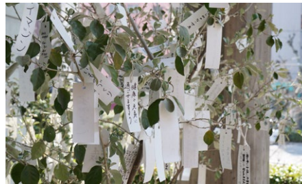
オノ・ヨーコ《念願の木》2014、東長寺(東京)