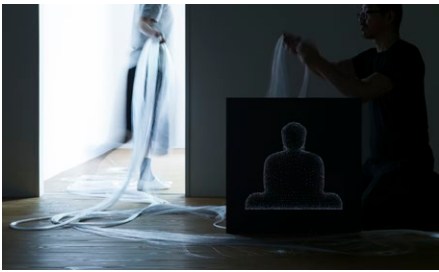
試作版を使った展示テストより