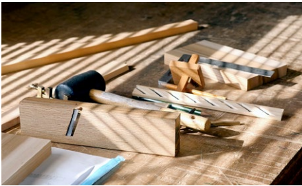
山城大督 映像作品《回向/ECHO》2015